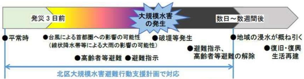
図 北区大規模水害避難行動支援計画の適用範囲

北区大規模水害避難行動支援計画の適用範囲は、平常時から大規模水害発生後数日～数週間（地域の浸水が概ね引く頃まで）としています。