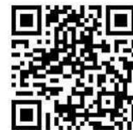
北区メールマガジン