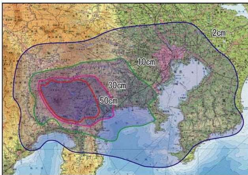
降灰予想図（降灰の影響がおよぶ可能性の高い範囲）