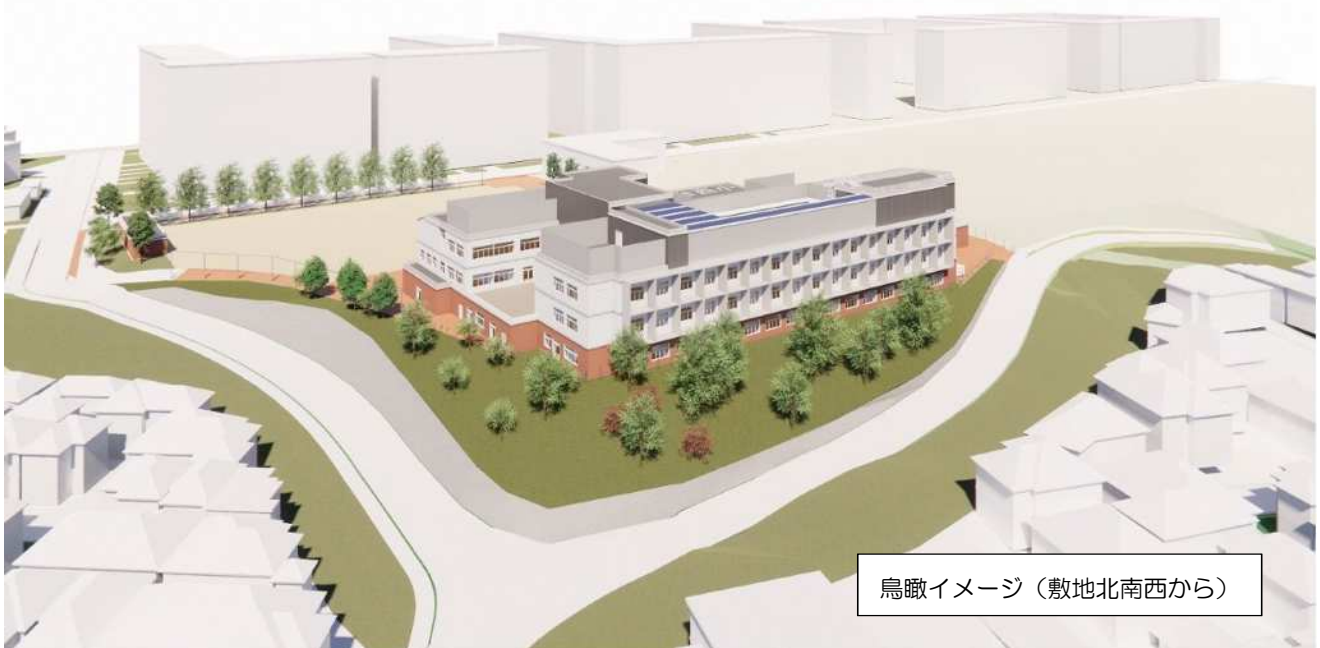
鳥瞰イメージ（敷地北南西から）

○地域のシンボルとして、地域とともに児童（西の子）の成長と地域の発展に貢献できるよう願いを込めたコンセプトとしています。