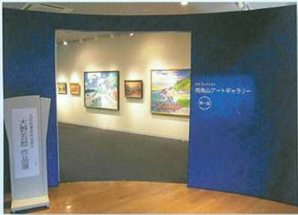
アートギャラリー 第1室

飛鳥山アートギャラリー・閲覧コーナー 北区所有の美術工芸品を展示しています。 図書を読覧できます。