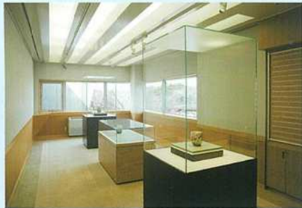
アートギャラリー 第2室