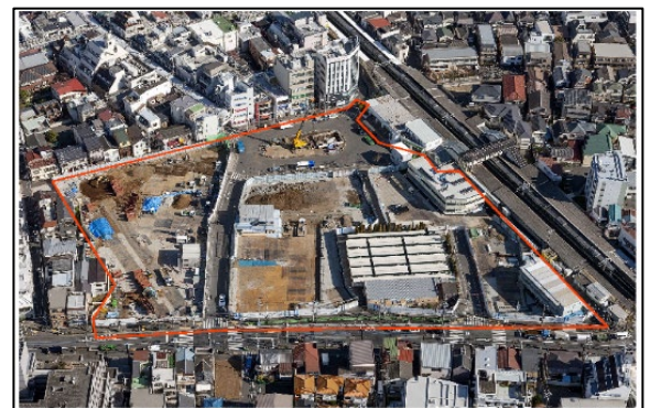
航空写真（令和3年2月末現在）

十条駅西口再開発相談事務所 北区十条仲原1-20-10 電話：03-3907-6722