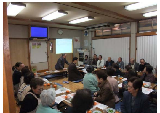
ミニ防災学習会の様子

今後も地元の行事に伺う「防災ミニ学習会」を行うことにしていますので、ご協力の程よろしく申し上げます。