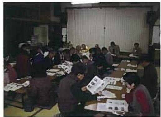
ミニ防災学習会の様子

今後も地元の行事に伺う「防災ミニ学習会」を行うことにしていますので、ご協力の程よろしくお願ひします。