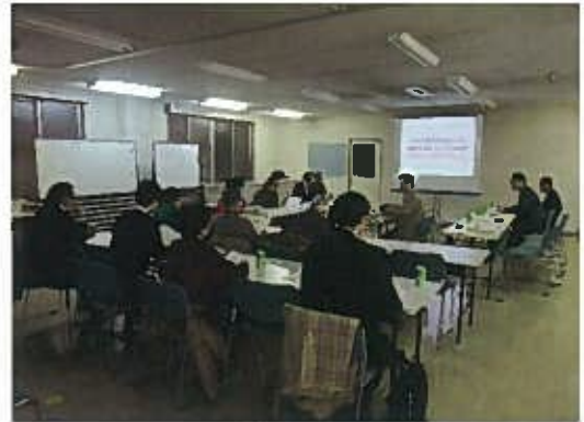
駅西ブロック部会の様子

今年度の駅西ブロック部会では、8月24日に第15回ブロック部会、12月27日に第16回ブロック部会、3月4日に第17回ブロック部会を開催して、まちの防災性向上について、道路の役割や建物の耐震化などについて学習しています。また、十条駅西口再開発準備組合事務局からの報告などを含め、今後も駅西ブロック部会で意見交換を行うことを予定しています。