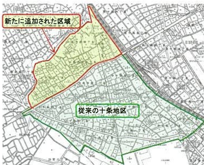
拡大した十条地区の区域

「十条地区まちづくり基本構想」の改定案は、庁内で検討中ですが、平成23年の夏頃にはパブリックコメントなどを通して、皆様のご意見をお聞かせいただき、同年秋頃に公表する予定です。ご理解とご協力をお願いいたします。