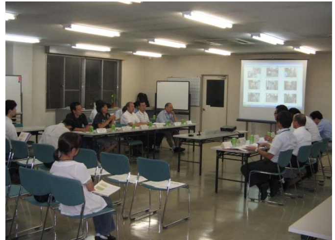
駅西ブロック部会の様子

今年度の駅西ブロック部会では、8月24日に第13回ブロック部会、3月2日に第14回ブロック部会を開催して、住まいとまちの防災対策について学習しています。また、まちの問題点の整理と解消方法についての学習を行い、今後も駅西ブロック部会で学習を継続していくことにしています。