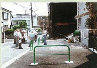
道路拡幅が進んでいます