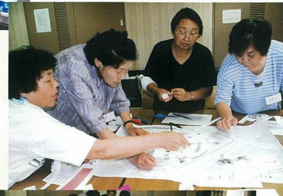
花壇はどこがいい?