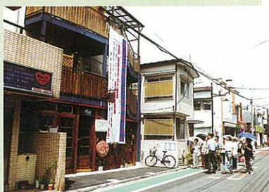
建物が後退しました