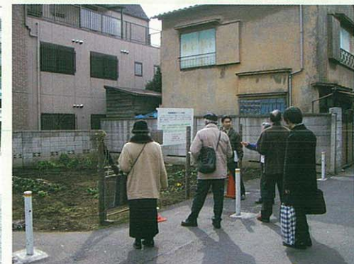
上三ふじ広場用地