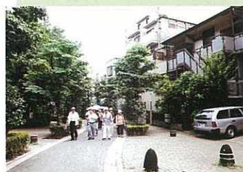
不燃化が進んだ 街並み