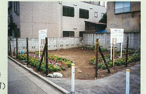
上十条三丁目2番10号 (面積約97㎡)

今後は、来年に広場整備のためのワークショップを予定し、平成15年度に公園の整備を考えています。皆様のご協力をお願いいたします。