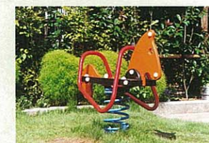
ゆらゆら スプリング遊具