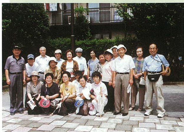
三丁目の皆さん(どれみふぁ緑地にて)