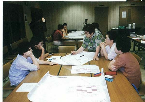
この時間帯は、誰が使うかしら?

6月25日(上十条子どもクラブ)と6月30日(上十条ふれあい館)に、子供たちが公園の絵を描いてくれました。