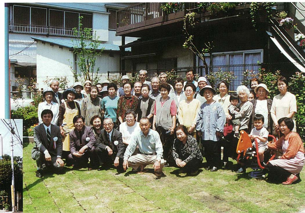
開園式に集まっていた皆さん