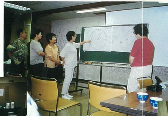
みんなで考えました