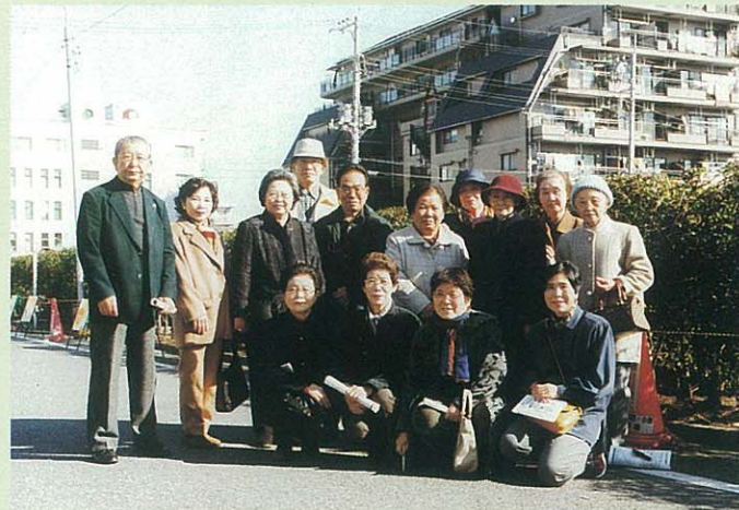
参加された上十条三丁目のみなさん