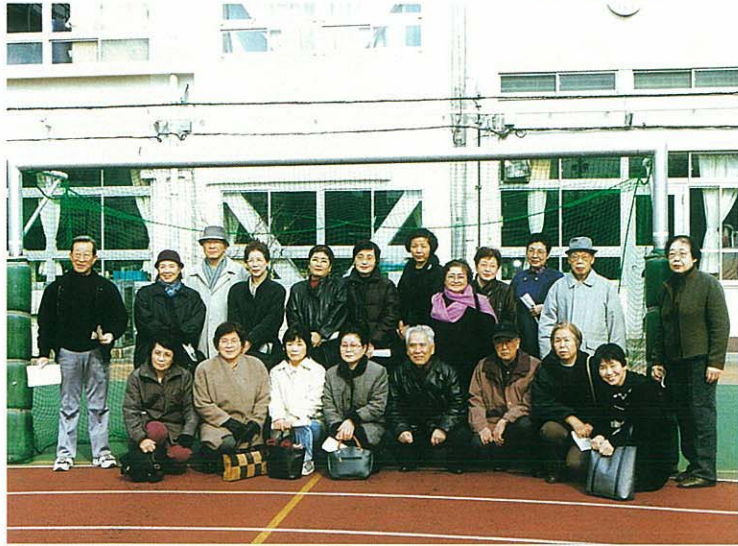
椎名町小学校校庭にて