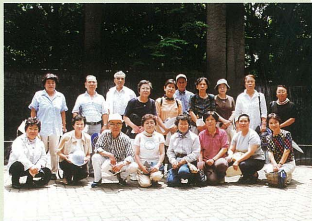
四丁目の皆さん(蚕糸の森公園にて)

蚕糸試験場跡地周辺地区は、「安全で住みよい、うるおいのあるまち」実現のために、地区計画の策定、不燃化の促進、防災上重要な道路の整備を進めてきました。不燃化促進事業、密集事業は終了しましたが、まちづくりは、まだまだ続いていきます。