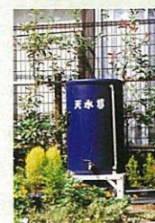
雨水をためる 天水尊