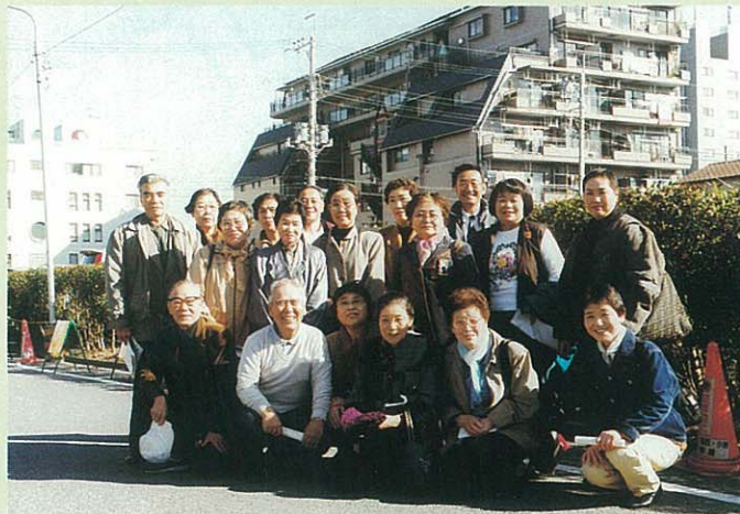
参加された上十条四丁目のみなさん