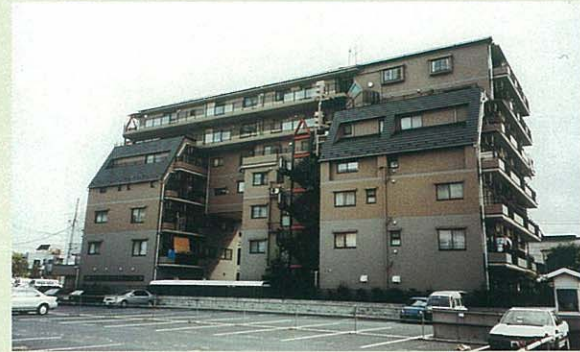
共同建て替えビル

そんな中、地元権利者の方々が共同で建て替えを行って、これらの問題を解決しました。