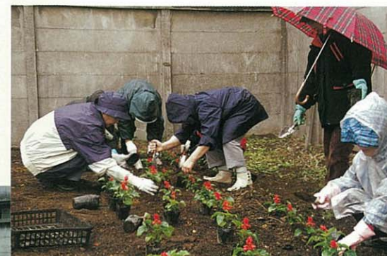
雨の中の花植え、お疲れさまでした(H13.4.21)