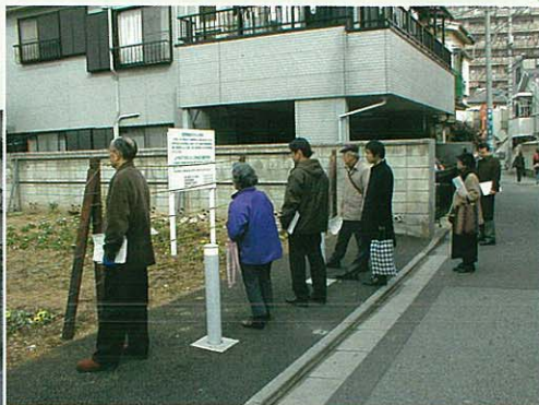
上十条三丁目まちづくり事業用地