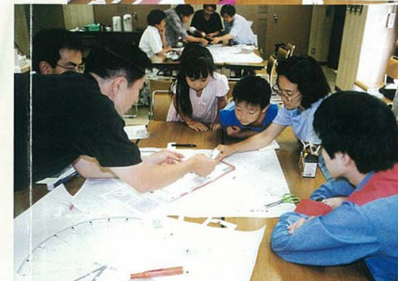
このへんに木を植えてみようか