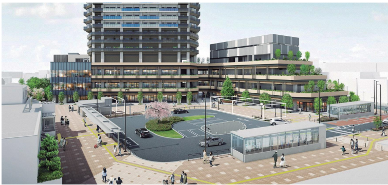
駅前広場イメージ