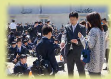
小中合同引き取り訓練

防災教育小中一貫年間指導計画を策定し、それに基づく防災授業や体験等を実施します。また、小中合同引き取り訓練や地域総合防災訓練など、保護者・地域と連携した小中一貫型防災教育を推進します。