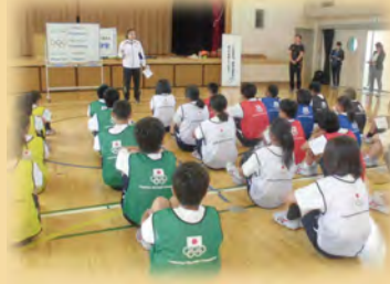
オリンピックと一緒にJOCオリンピック教室

オリンピック・パラリンピアンとの交流を通して、運動・スポーツにより一層親しむ取組、体力や健康の保持増進を図る取組、オリンピック・パラリンピックの歴史や意義、理念などを学習する取組、国際理解を深める取組などをオリンピック・パラリンピック教育アワード校として推進していきます。