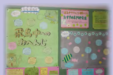
小中によるポップ交流の掲示

学校図書館指導員(学校司書)を活用し、学校図書館の整備を進め、読書活動や言語活動の一層の充実を図ります。活動の一環として小学生、中学生それぞれが自分の読んだ推薦本について作成したポップによる交流をしています。北区民としての教養の基礎を培うため、読み聞かせや読書習慣、自立した生き方を目指す読書の方法などの教育を推進します。