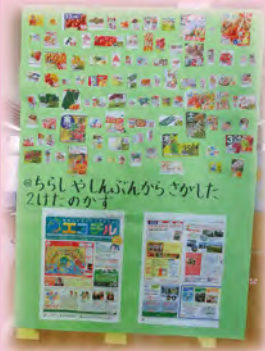
新聞を活用した算数の授業

NIE(Newspaper In Education の略、新聞を教材・学習材として活用する学習)の手法を取り入れ、言語活動の充実を図るとともに、情報活用能力や思考力・判断力・表現力等を育成します。社会の出来事に興味をもち、生涯にわたって学び続ける基礎を育みます。