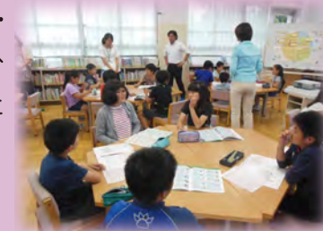
コミュニケーションによる課題解決型授業

一人ひとりの社会的・職業的自立に向け、必要な基盤となる能力や態度（自立した社会人として生きるために必要な力）を育みます。「基礎的・汎用的能力」の育成を通して、自立・協働・創造に向けた一人ひとりの主体的な学びにつなげていきます。