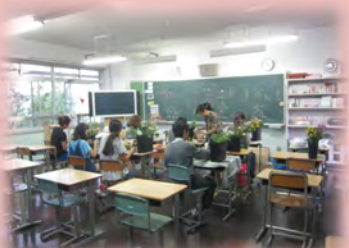
オープンスクール【アレンジ生け花】の様子

地域の方々をゲストティーチャーとして招へいし、田端に根付いた文化等を学ぶ「田端学びの郷オープンスクール」を開催しています。田端小・滝野川第四小6年生、田端中の児童・生徒と一緒に学ぶことで、異年齢集団の交流を図り、地域とともに学ぶ態度を育みます。