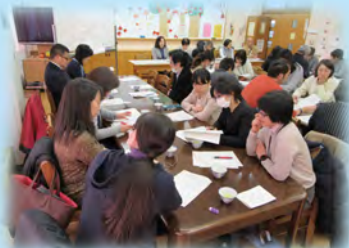
不登校支援についての情報交換

「桐ヶ丘心の教育ネットワーク」として、桐ヶ丘地域の心の教育を充実させ、豊かな教育力を育みます。SFを中心として、学校の道徳教育の充実を目指すとともに、保護者や地域関係機関と連携しながら推進します。平成30年度は、スクールソーシャルワーカーの活用による不登校改善に取り組んだ成果を生かし、平成31年度も引き続き小中の円滑な連携を推進します。