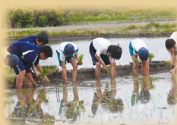
小中合同農業体験

「学びの一貫性」(学習スタンダード)をもたせるとともに、体験学習に基づく援農教育は、区内唯一の特色ある教育活動であり、小・中学生の共同作業へと展開をしています。また、一貫性のある生活指導や学校行事のコラボを行い、9年間を通じて系統的に子どもを育てていきます。