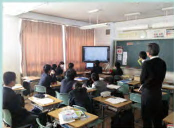
ICTを取り入れた授業

新聞の読み比べや付箋を利用した情報のまとめ、調べ学習・発表等の情報活用を取り入れた授業、また、電子黒板や携帯情報端末、デジタル教科書等のICTを取り入れた授業の取り組みを通して、思考力・判断力・表現力と他者とかわる力を育成する新しい学びを創造します。