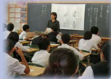
言語力を育成する授業

言語環境を整えるとともに、言語に対する関心や理解を深め、思考力のベースとなる言語力を育成します。各教科においては、対話・記録・要約・説明・発表・討論などの言語活動を充実させ、論理的思考力や表現力を育成します。