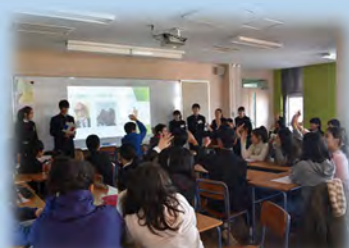
東京国際フランス学園との交流

イングリッシュサポーター(外国人講師)が、放課後に英会話講座等を行うイングリッシュプラザを開催し(中学校を中心として実施)英語の力を高めていきます。また、コミュニケーション能力の向上に向けた授業改善や東京国際フランス学園との交流などを通して、国際理解教育を推進します。