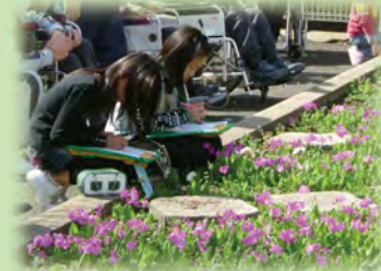
さくら草の写生授業

「花・音・風-情操教育の推進-」として、浮間地域の豊かな自然環境を生かし、地域の方々と伝統あるサクラソウの栽培を通して、郷土を愛する心を育みます。また、音楽交流やボランティア活動などを推進して、社会貢献できる豊かな心をもった児童・生徒を育成します。