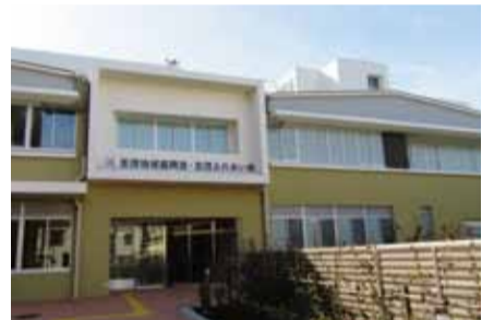
志茂地域振興室・志茂ふれあい館入口