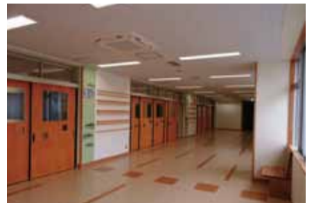
教室前のオープンスペース