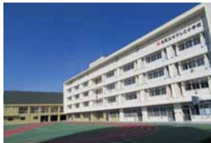
校舎・体育館外観

また、太陽光パネルの設置、トイレの排水の雨水再利用、すべての照明にLEDを採用するなど、環境に配慮した施設となっています。