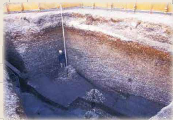
発掘調査の様子(中里貝塚)