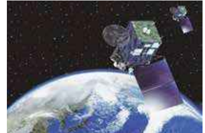
気象衛星ひまわり