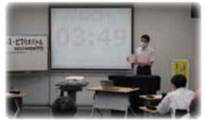
▲ティーンズ・ビブリオバトルの様子