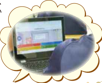
←電子黒板のスクリーンに、『きたコン』の画面を表示

ICT活用ポイント② 『きたコン』の学習支援ツールを利用して、先生が出した問題を解いて提出し、クラス全体で回答を共有していました。問題を解いた生徒が、答えが分からない生徒に考え方を共有している姿も見ることができました。