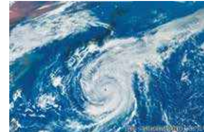
令和元年東日本台風(2019年)の気象衛星ひまわり画像

国際的な全球海洋観測網により、世界中の海に観測用ブイを設置して海の中を調べたり、宇宙からは気象衛星ひまわりが海面水温や葉緑素クロロフィルaの量を計測したりする技術が発展してきています。 (お茶の水女子大学 貞光千春)