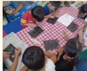
▲スクラッチアート(わくわく梅木ひろば)