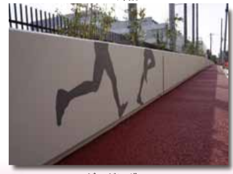
▲ジョギングコース