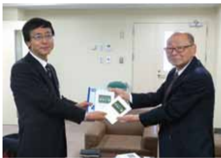
▲贈呈の様子(左:清正教育長、右:須貝東京北支部長)

子どもたちのマナーや防犯意識などを高めるための副読本として活用させていただきます。ありがとうございました。