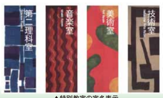
▲特別教室の室名表示