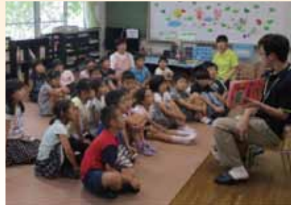
▲読み聞かせ(わくわく谷端ひろば)