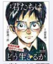
マガジンハウス 漫画版