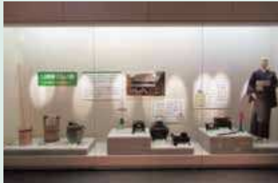
着物やちゃぶ台なども展示されているよ！

ガスや電気、水道がほとんどの家で使えなかった時代から次第に使えるようになる時代にかけて、人力やまき、炭などの力を利用した道具が、多く使われていました。