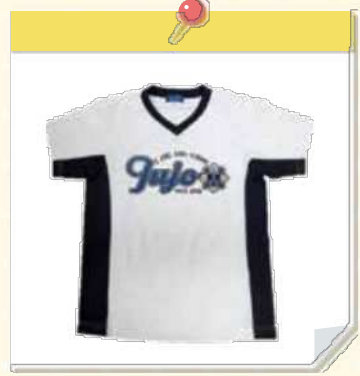
児童が使用する校帽や体育着にも、校章がデザインされています。