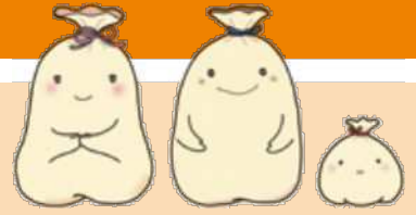
博物館イメージキャラクター (左から) チエちゃん・フクちゃん ・ローちゃん

昔の道具やくらし・街の様子を写した古写真や地図などを多数展示し、くらしや街のうつりかわりを調べる展示です。