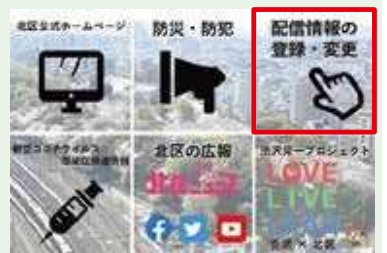
▲「配信情報の登録・変更」