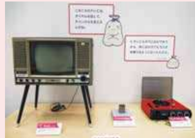
テレビには脚がついているね！

団地やマンションが立ちならび、ガスや電気、水道がくらしの中ですっかり当たり前のものとなったこの時代は、電化製品や便利な道具がたくさん登場しました。