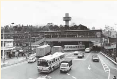
40年前の王子駅と飛鳥山公園。 昔は大きな回転展望台があったんだね！

北区ができたころは畑や田んぼがたくさんありましたが、時代のうつりかわりとともに、工場や家などいろいろな建物が立ちならぶようになりました。