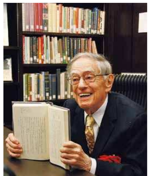
日本文化と日本文学の伝道師 ドナルド・キーン氏 (1922年6月18日-2019年2月24日)

日本や北区について広く発信してくださったキーン先生。今度は私たちが先生の研究を知り、改めて日本文学に親しむきっかけとなればと思います。