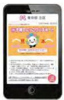
「デジタルパスポート」 の画面