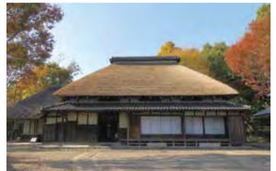
北区ふるさと農家体験館

北区ふるさと農家体験館では、季節とともにある農家の暮らしを感じることができる年中行事を再現しています。