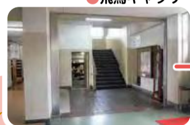
●飛鳥ギャラリー(交流ギャラリー)