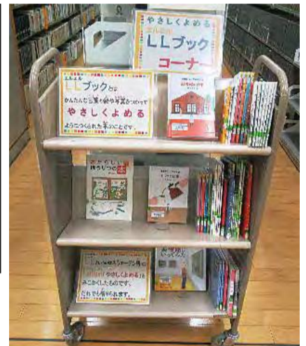
中央図書館LLブックコーナー

○の本やサービスは、どなたでも利用できます。 *の本やサービスは、お住まいや障害の級などに利用の条件があります。詳しくは、下記までお問い合わせください。