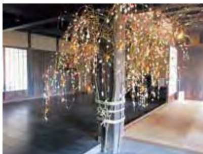
マユダマダンゴの飾り付け