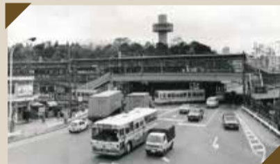
王子駅前の様子(40年くらい前)

北区ができたころは畑や田んぼがたくさんありましたが、時代のうつりかわりとともに、工場や家などいろいろなたてものが立ちならぶようになりました。