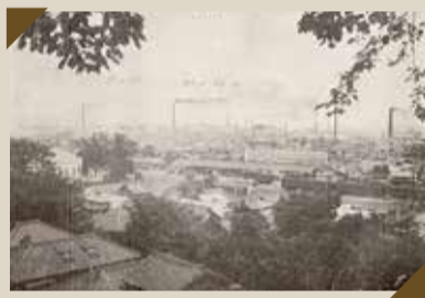
飛鳥山から見た王子の工場群 (100年くらい前)