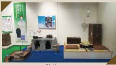
写真は過年度の展示の様子です。

今から100年～70年ほど前に使用された道具を展示しています。ガスや電気、水道がほとんどの家で使えなかった時代から、だんだん使えるようになった時代では人力やまき・炭などを利用した道具が多く使われていました。