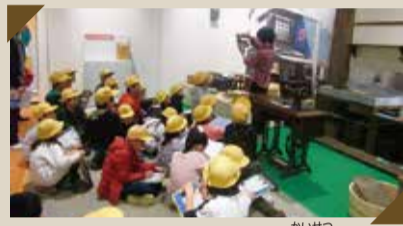
学校見学の時間は、学芸員が解説します。