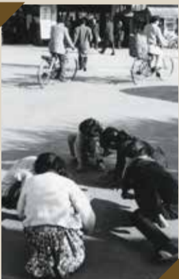
子どもの遊び(60年くらい前)

100年～40年ほど前までの北区内の様子を写した古い写真を地図と一緒に展示しています。