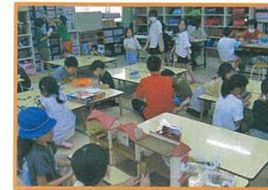
室内遊び (わくわく西が丘ひろば)