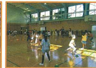
体育館遊び (わくわく滝野川ひろば)