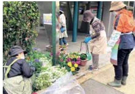
植栽ボランティア「花と緑のくらぶ」

問場 いきがい活動センター きらりあ北(王子5-2-5-101) (UR王子5丁目団地内) 開館:午前9時～午後10時 ☎(5390)2220 FAX(5390)2233 EM kitaku-ikigai@foryou.or.jp