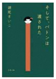
『そして、バトンは渡された』 瀬尾まいこ/著 文春文庫