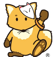
北区認知症支援キャラクター 「こんちゃん」