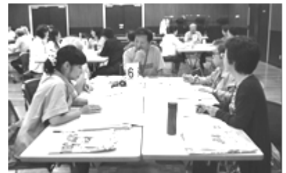
介護予防リーダー養成講座

地域で介護予防活動をやりたい区内在住・在勤の方（原則、全日程参加可能な方）を対象に、介護予防の必要性を知り、知識や技能を身につけ、地域に介護予防を広めるためのリーダーを養成しています。