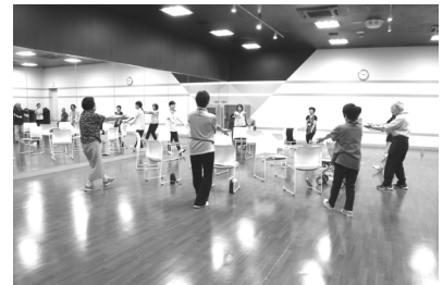
介護予防体操教室の様子

トレーニングマシンの体験をしながら、体操などの運動習慣を身につけ、教室終了後も運動を続けられる自主グループをつくります。