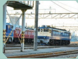
尾久車両センター

JR東日本の車両基地。常時回送列車が停車しているので、フェンス越しではありますがじっくり見て写真を撮ることができます。時にはレアな電車と出会えるかも!?