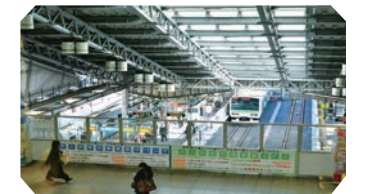
アトレヴィ田端 2F「ガーデンテラス」

JR田端駅と直結した駅ビル。2F、TSUTAYAとスターバックスの間にある無料スペース。電車さんぽの後はここでひと息。お茶を飲んだり、TSUTAYAの本を読んだりしながらホームに入ってくる電車を見下ろせます。3Fのトイレではおむつ替えもできますよ。