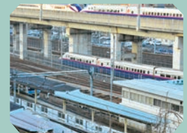
田端駅南口 スロープ

JR田端駅の跨線橋を上り南口改札を出て、ゆるやかなスロープを行くと、新幹線、在来線、貨物列車が見えます。新幹線、在来線、貨物列車が同じタイミングで交差する時は子どもも大喜び。夏にはアジサイが咲き誇り、電車風景を彩ります。