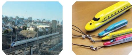
ホテルメッツ田端

シングルルームから東北新幹線、秋田新幹線、上越新幹線などがパッチリ見える電車ビュースポットの名所。線路の模様のカーペット、電車の座席と同じ素材で作った椅子など部屋の内装も電車づくし。Nゲージや新幹線ストラップ等のお土産までついてきて、電車好きにはたまらないホテルです。