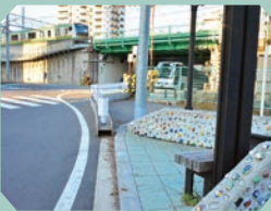
下田端夜雨 (しもたばたやう)

実際に使われていたレールで作ったベンチや、電車の信号機のモニュメントがある休憩エリア。腰掛けて高架上を通る特急列車を待ってみたり、運がいい時は、すぐ脇の線路を回送列車が通るかも…!