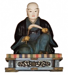
太田道灌坐像 (静勝寺)