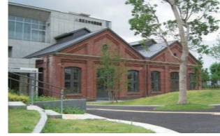
中央図書館 (赤レンガ図書館)

主な見どころ 醸造試験所跡地公園、滝野川病院一帯 四本木稲荷神社、中央公園文化センター、中央図書館