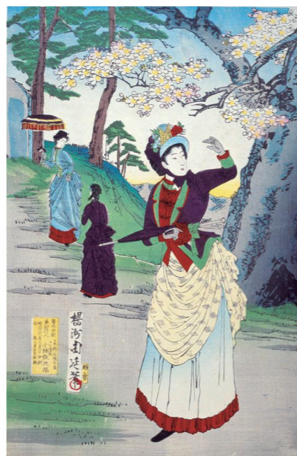
「飛鳥園遊覧之図」(部分) 梅洲周延画 明治21年 北区飛鳥山博物館所蔵