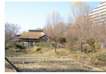
赤羽自然観察公園