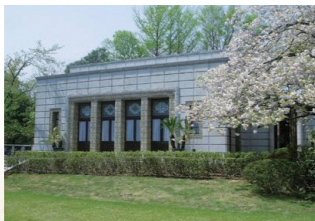
旧渋沢庭園 (飛鳥山公園内)