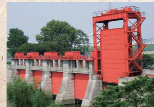
赤水門 (旧岩淵水門)