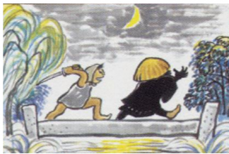
てっかんぼうが出たぞ (甚兵衛堀跡) 【北区の昔がたり 北区郷土資料館シリーズX】 北区教育委員会発行