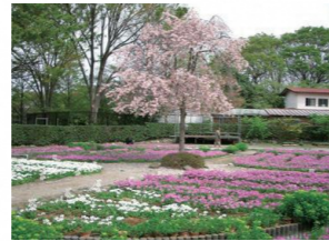
浮間ヶ原桜草園場

主な見どころ 荒川防災ステーション、観音寺 氷川神社、浮間ヶ原桜草園場、北向地藏堂