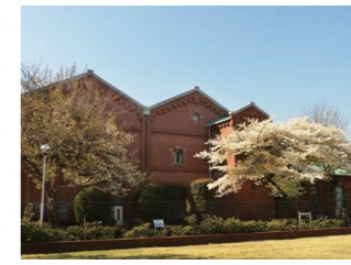
旧醸造試験所第一工場

主な見どころ 洋紙発祥之地碑、旧醸造試験所第一工場 旧渋沢庭園 (晩香廬・青淵文庫)、西ヶ原一里塚