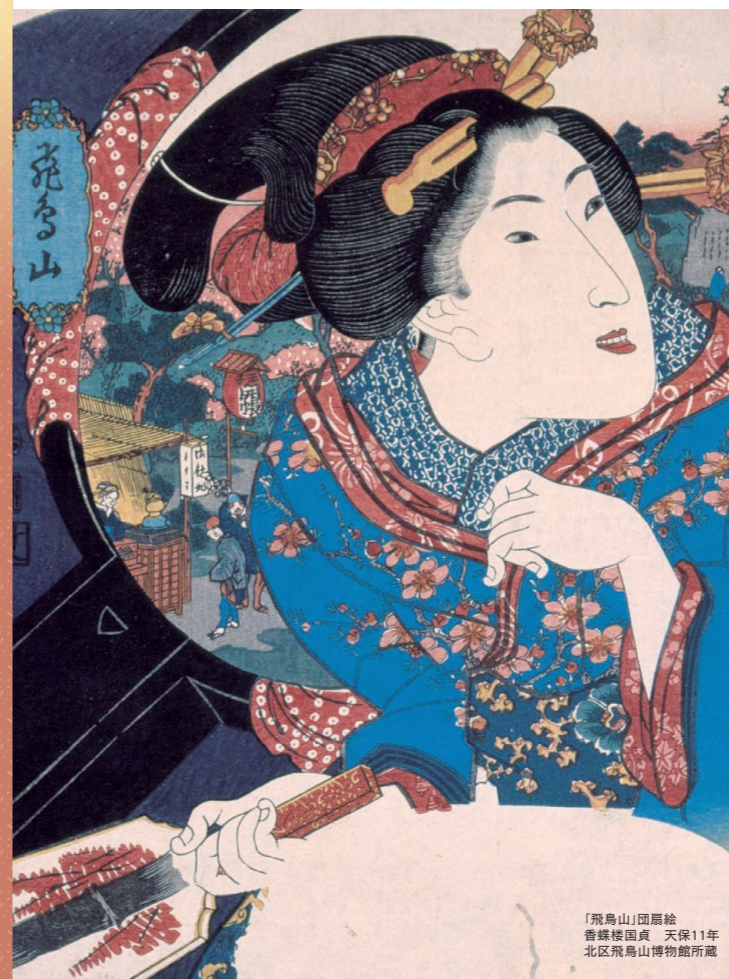
「飛鳥山」団扇絵 香蝶楼国貞 天保11年 北区飛鳥山博物館所蔵