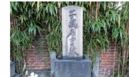
正岡子規墓 (大龍寺)

主な見どころ 田端文士村記念館、童橋公園 (室生 犀星旧居の庭石)、芥川龍之介旧居跡、與楽寺 天然自笑軒跡、東覚寺、大龍寺