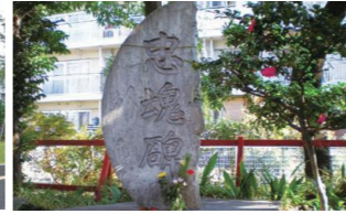
忠魂碑 (四本木稲荷神社)