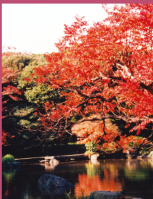
旧古河庭園の紅葉

日本庭園の六義園、洋風庭園と日本庭園が調和した旧古河庭園、という美しい庭園めぐりが楽しめます。また、二葉亭四迷をはじめとする著名人たちが眠る霊園、お寺にも立ち寄ります。