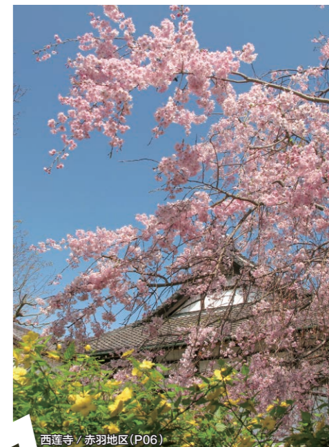
西莲寺 / 赤羽地区 (P06)