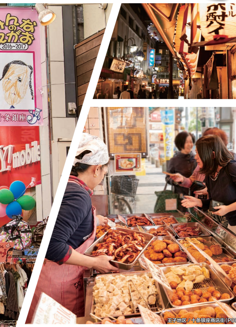
王子地区 / 十条银座商店街 (P08)