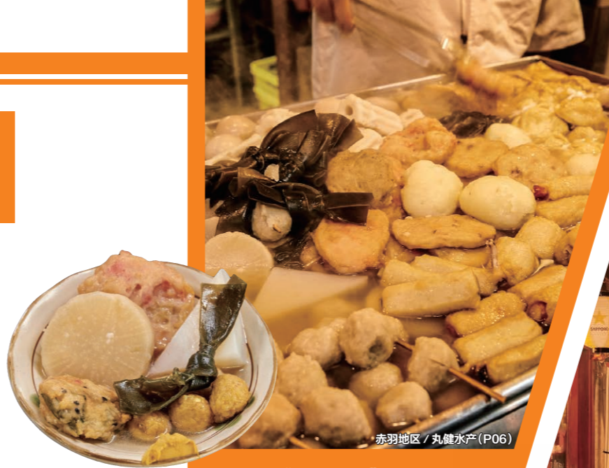
赤羽地区 / 丸亀水産 (P06)

因为有许多私人小店，在与店员交谈中定会感受到下町的风土人情吧。另外，还拥有以“赤羽一番街商店街”为首的，作为东京饮食街代表而广为人知的商店街。与那些下班归来、想彻底放松畅饮的人们一起吃晚饭、品美酒，体验一下日本人的日常生活如何？