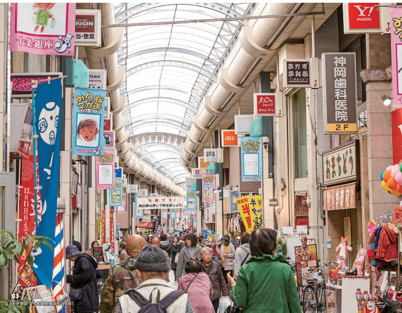
王子地区 / 十条银座商店街 (P08)