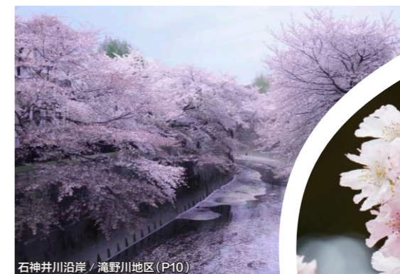
石神井川沿岸 / 滝野川地区 (P10)