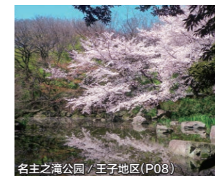
名主之滝公园 / 王子地区 (P08)