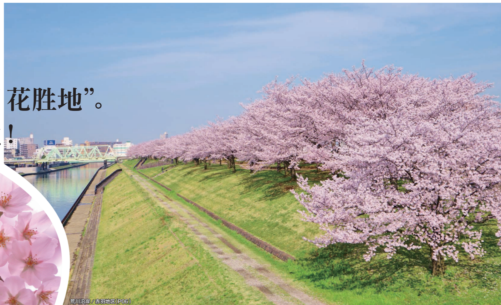
荒川沿岸 / 赤羽地区 (P06)