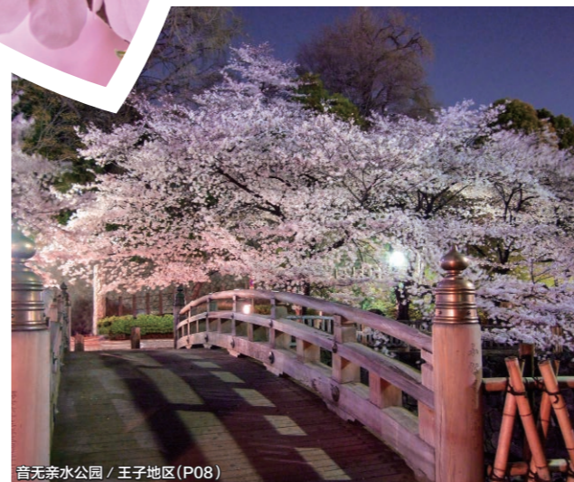
音无亲水公园 / 王子地区 (P08)