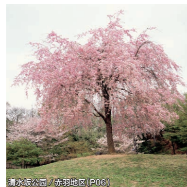
清水坂公园 / 赤羽地区 (P06)