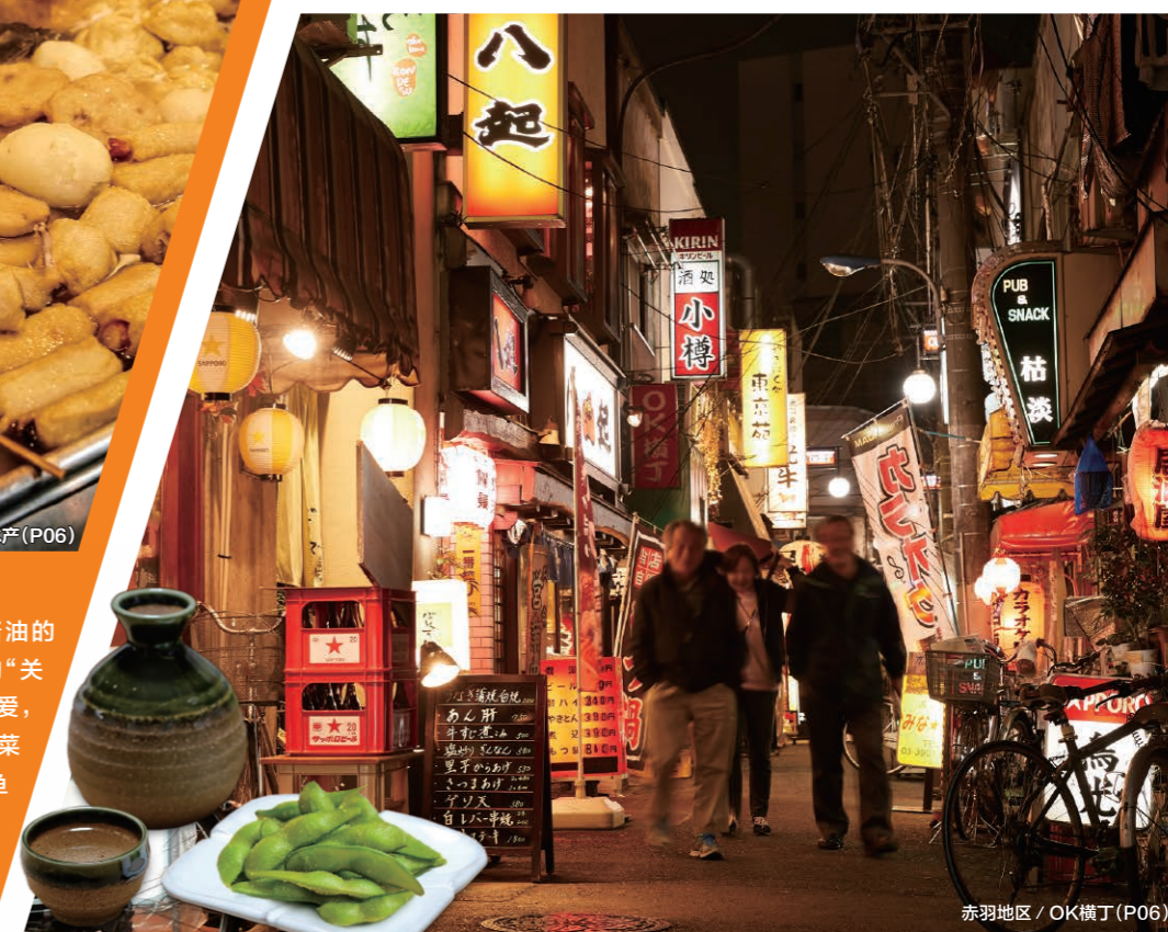
赤羽地区 / OK横丁 (P06)

各种各样的食物经过长时间炖煮，酱油的醇香完全进入材料中，这就是所谓的“关东煮”。作为当地的名吃深受人们的喜爱，北区有很多关东煮店。传统的江户蔬菜（萝卜、牛蒡、胡萝卜）、竹轮（圆筒状鱼糕）、豆腐包以及以各种鱼肉为原料的食物供您任意选择，吃后定能令您身心温暖无比。