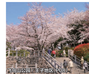
飞鸟山公园 / 王子地区 (P08)