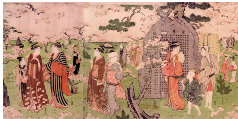
飞鸟山赏花 三张大纸相连 ( 胜川春潮/1781-88年前后 ) 北区飞鸟山博物馆收藏 江户幕府时代的第8代将军为了鼓励平民赏花，大约300年前在飞鸟山种植了1270棵樱花树。如今在广阔的丘陵上依然盛开的美丽的樱花以及赏花人们接踵而至的身姿，与当时春天的景象别无二致。