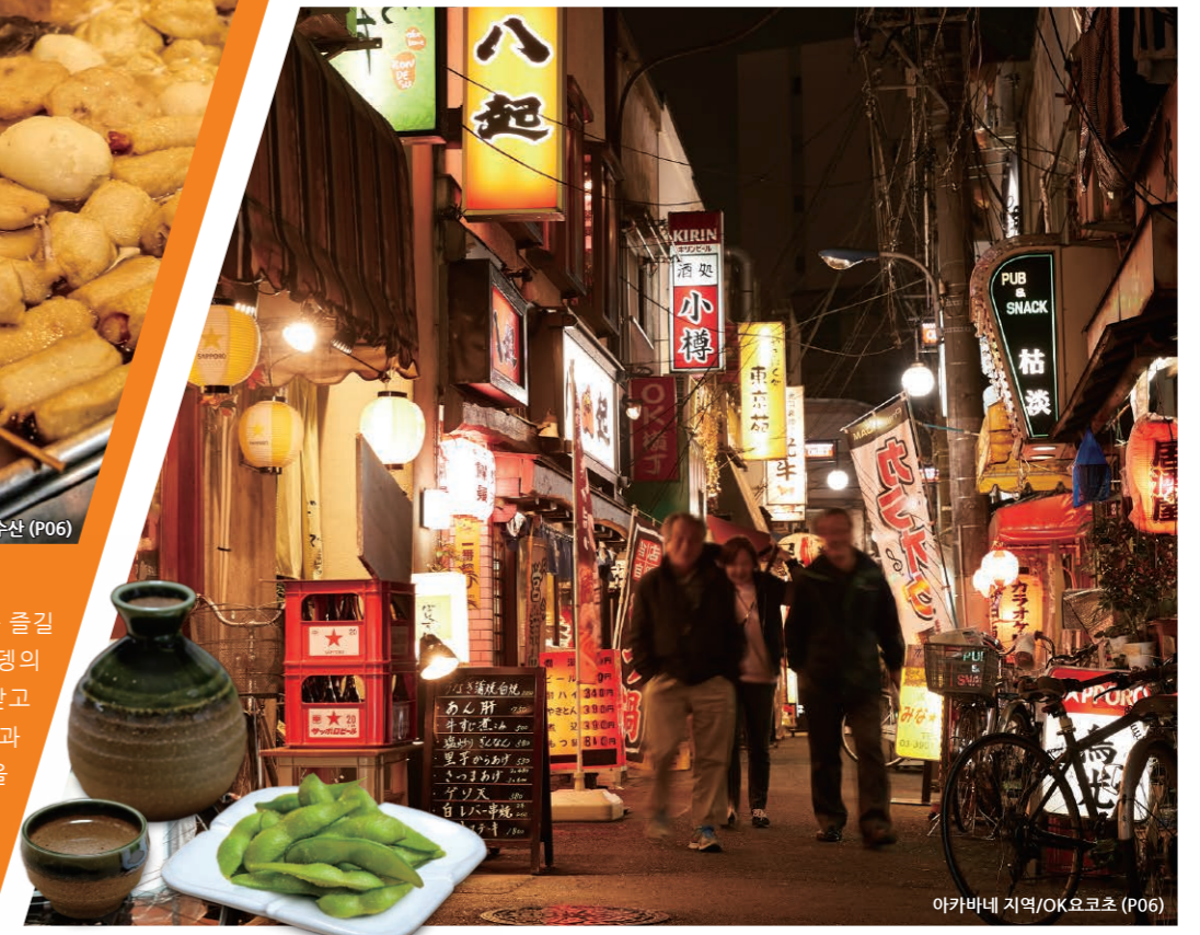
아카바네 지역/OK요코초 (P06)

명물 「기타 구 오뎅」을 먹어보자! 간장 맛의 국물이 스며든 다양한 재료를 즐길 수 있는 요리 '오뎅'. 기타 구에는 오뎅의 유명점이 많아 지역의 명물로서 사랑받고 있습니다. 에도 전통 야채(무, 우영, 당근)과 지쿠와부, 긴차쿠, 어묵 등 좋아하는 것을 골라 먹으면 몸도 마음도 따끈따근해 집니다.