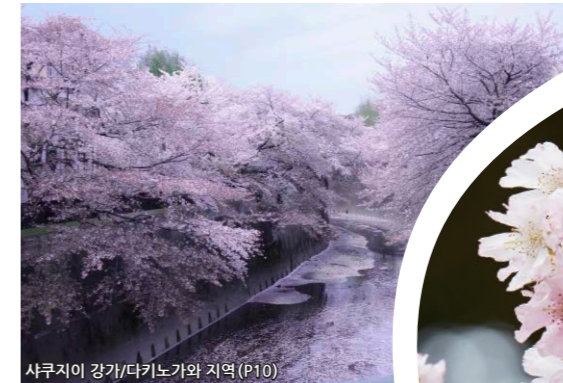
사쿠지이 강/다키노가와 지역 (P10)