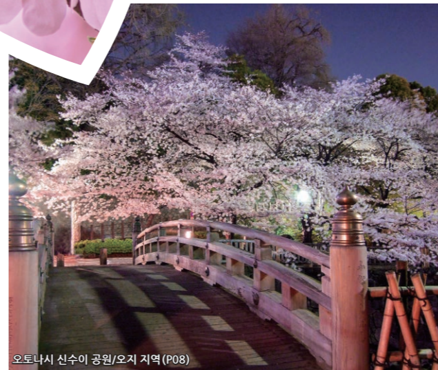
오토나시 신수이 공원/오지 지역 (P08)