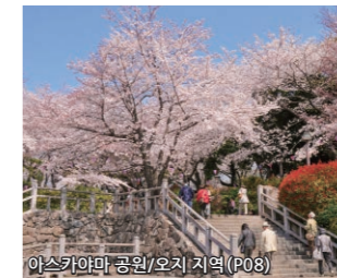
아스카야마 공원/오지 지역 (P08)