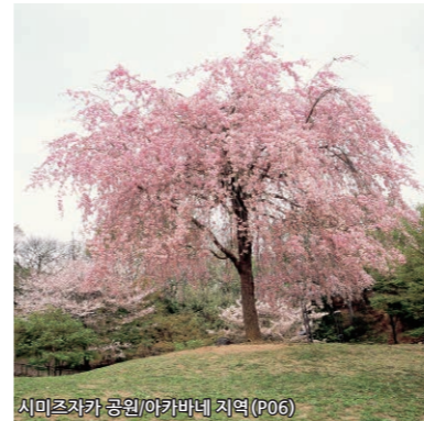
시미즈자카 공원/아카바네 지역 (P06)

아스카야마 벚꽃놀이 대형3장 연속(가쓰카와 순초/1781-88년경) 기타 구 아스카야마 박물관 소장 에도 막부 제8대 장군이 서민에게 꽃놀이를 장려해 아스카야마에 1270그루의 벚나무를 심은 것은 약 300년전. 넓은 구릉지에 만발한 아름다운 벚꽃과 꽃놀이를 즐기는 사람들의 모습은 당시부터 변하지 않는 봄의 풍경입니다.