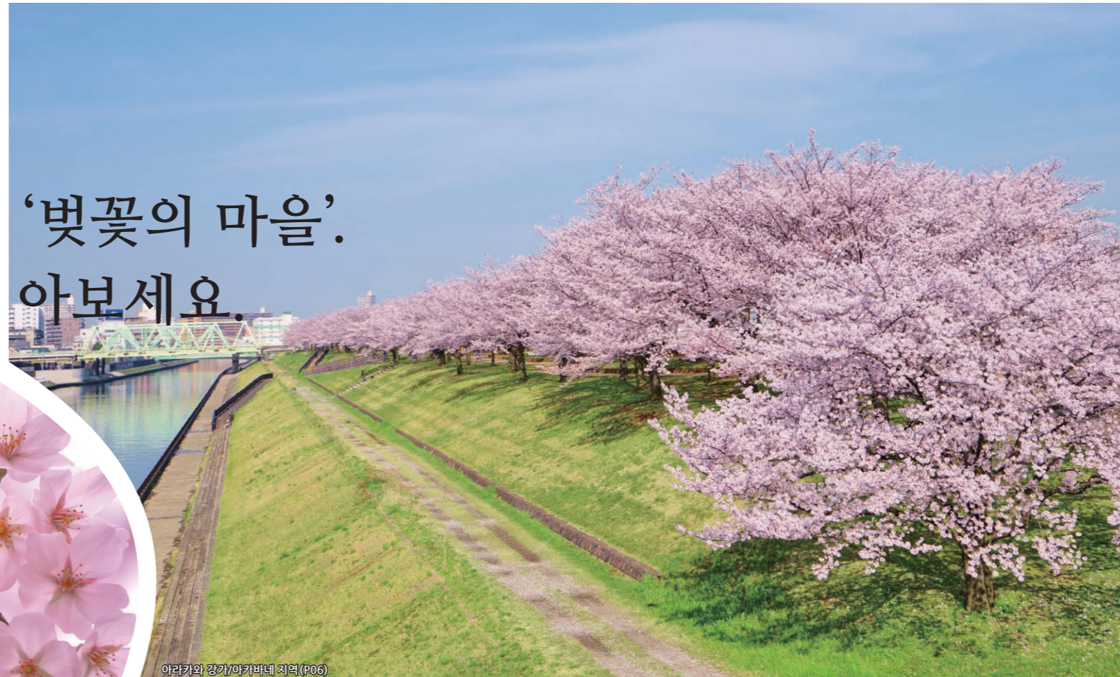
아라카와 강/아카바네 지역 (P06)