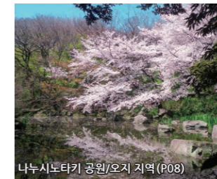
나누시노타키 공원/오지 지역 (P08)