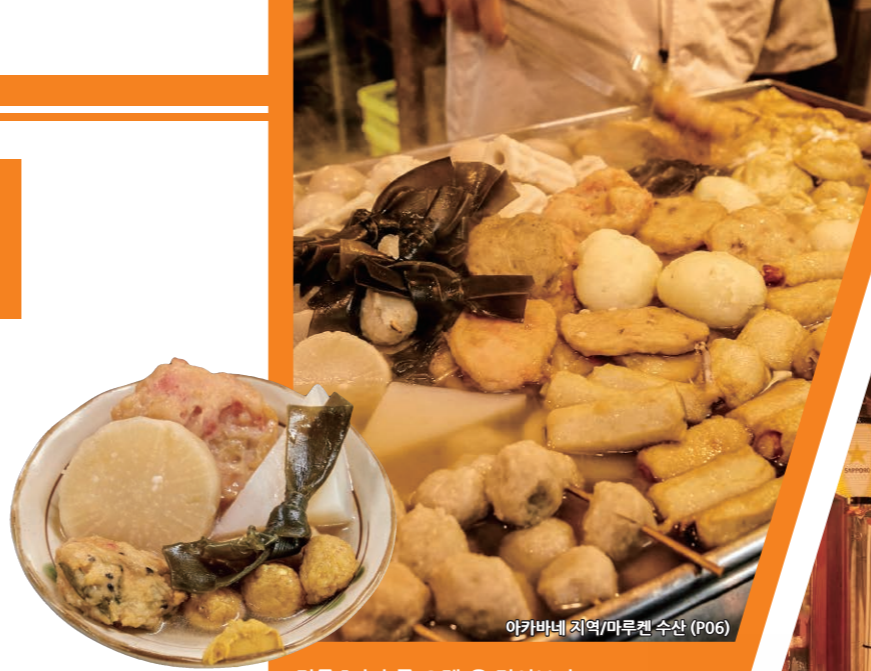
아카바네 지역/마루켄 수산 (P06)

개인 상점이 많아서 점원과 이야기를 주고 받으면 서민마을다운 인정미를 느낄 수 있을 것입니다. 또한 '아카바네 이치반가이 상점가'를 비롯해 도쿄를 대표하는 술집 거리로서 유명한 상점가도 있습니다. 퇴근길에 하루의 피로를 푸는 직장인들 속에서 저녁을 먹거나 술을 마시면서 일본사람들의 일상을 체험해 보세요.