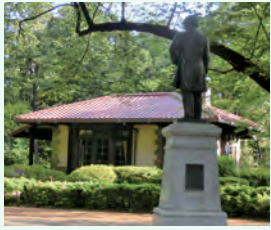
晩香廬と渋沢翁の全身像