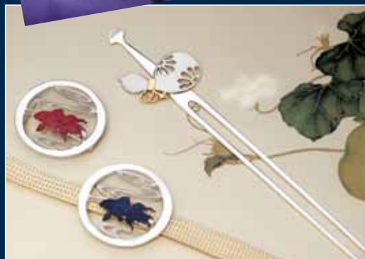
銀製 帯留 金魚(素銅・赤銅)、銀製 瓢箪のかんざし