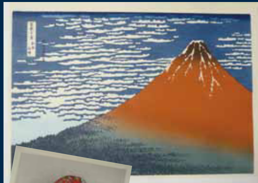
浮世絵版画 葛飾北斎「富嶽三十六景 凱風快晴」 摺師:沼辺伸吉

木版画に興味のある方はご連絡ください。 携帯メール: shinkichi-2713@willcom.com PCメール: numabe-koubou@sb4.40-net.ne.jp