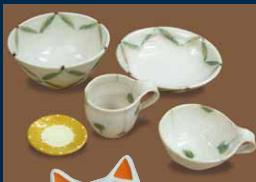
陶器 鉢、皿、カップ、小皿

[見学・体験] 要連絡: Tel.03-5974-3868(火~土13:00~20:00/日月定休) 体験料: 1回2,000円(材料費込み)、約2時間 会場: サカイ工房 北区西ヶ原2-40-12-1F http://www.sakaikobo.net/