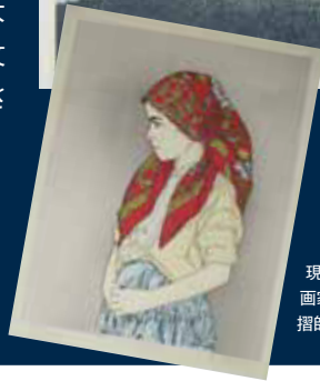
現代版画「ウズベクの少女」 画家:彫師:岡本流生 摺師:沼辺伸吉