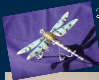
とんぼ玉と七宝の銀製 とんぼ(コラボ作品)