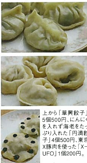
上から「華興餃子」5個500円、にんにくを入れず海老をたっぷり入れた「円満餃子」4個500円、東京X豚肉を使った「X-UFO」1個200円。

遠くから足を運ぶリピーターが多く、常連客の中には、引越した先でもあの餃子が食べたいと取り寄せを希望する人も。そうして始めた冷凍餃子の発送が、いまではホームページを通じた通販として定着しました。テレビ番組などでも取りあげられ、ファンは全国に広がっています。