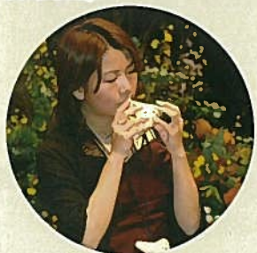
オカリナによる演奏が行われ、会場いっぱいやさしい音色が響き渡りました。