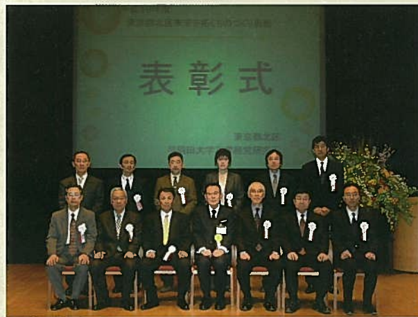
受賞者全員による記念撮影。

「北区未来を拓くものづくり表彰」は、区内の優れた技能・技術・企業活動などを表彰し、北区の「ものづくり」のすばらしさを広く周知するとともに、区内産業などの活性化を図ることを目的としています。第3回、平成19年度の受賞企業11社(者)の表彰式が、早稲田大学井深大記念ホールで行なわれました。