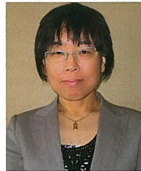
北区経営アドバイザー

正社員と同視すべきパート労働者については、賃金の決定、教育訓練の実施、福利厚生施設の利用をはじめとしたすべての待遇について差別的取扱いが禁止となりました。対象者となるかどうかの判断基準は次の3点です。この3つの基準について正社員と同様であるとする場合、正社員と同様の待遇を確保しなければなりません。