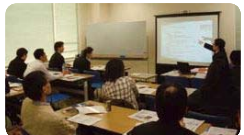
この日は3社の事業プレゼンテーションの後、名刺交換会を実施

事業プレゼンテーションの後、名刺交換等が行われ、そのまま居酒屋で懇親会という流れに。私も飲み会に参加しましたが、この時こそ「経営者って違うな～」と感じました。普通の会社員ならたいてい飲み会では仕事の話ってあまりしませんよね? 最近見た映画や旅行、上司や部下の愚痴、結婚・恋愛の話など。しかし、経営者の方はビジネスの話が圧倒的に多い。常にアンテナをはって吸収しようとする姿勢、色んなところに顔を出して出合いを大事にする姿勢がすごいです。皆さんの周りにも経営者の方がいたら一緒に飲んでみてはいかがですか? いつもの飲み会とは少し違うと感じるはず!