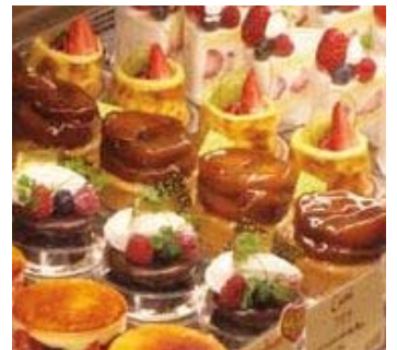
季節感あふれるシェフの自信作。春の訪れをケーキで感じてみませんか？

最後にシェフのこだわりを聞くと、開店からたったひとつだけ変えていないことがあるとのこと。経営が苦しかった時期に、お客様から「ショートケーキがとってもおいしい」とほめられ「今でもショートケーキだけは若い人に任せず、自分でつくっています」と笑いながら語ってくれました。