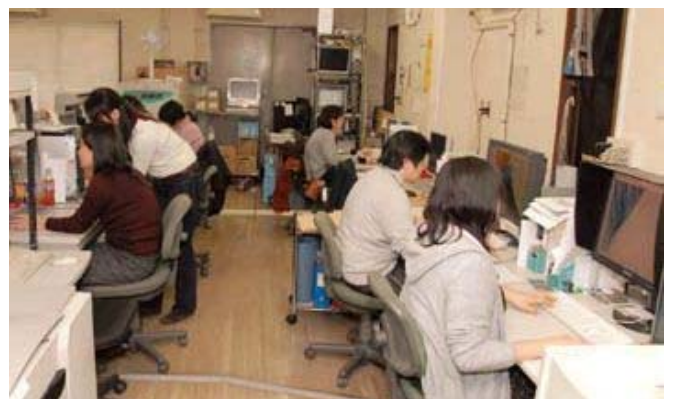
創業時は数名だったスタッフも、今や大所帯に。活気あるオフィス。

「父からの教えで、相手が仕事を頼んでくるときは、困っている時。内容や金額などの条件はさておき、まずは受ける。経験のない仕事であっても、できる方法を探します。スタッフへの要求は高くなりますが、それをこなすことによって、次のステップを踏むこ