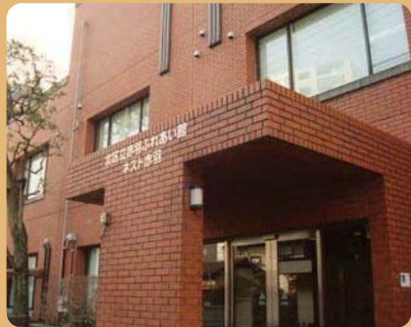
起業家をバックアップする施設「ネスト赤羽」

そこで今回の取材先は、創業支援施設「ネスト赤羽」。ネスト赤羽では、起業家へオフィスを貸し出したり、経営上の相談に乗ったり、様々なセミナーを無料で開催しています。取材日は、IT系の入居企業3社の事業プレゼンテーションが行われました。普段の生活に不可欠になってきたIT。そのIT業界で勝負する3社の経営者に独立したきっかけなどを伺いました。