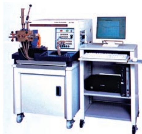
プラスチックやゴムなどの混練、ゲル化などを評価する試験機