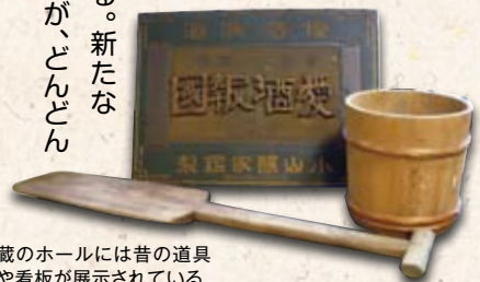
蔵のホールには昔の道具や看板が展示されている

を入れたマドレーヌやチョコレートなど菓子メーカーとのコラボレーションも実現している。新たなお酒の楽しみ方が、どんどん広がっています。