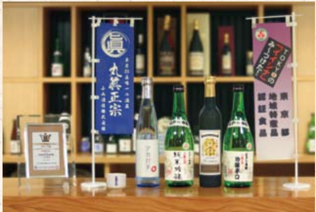
丸真正宗(東京都地域特産品認証食品)をはじめとした商品。