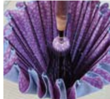
表地に鮫小紋、裏地に桜柄をあしらった蛇の目風の傘