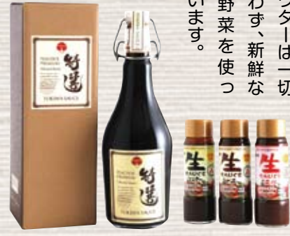
生野菜とスパイスの旨味が絶妙な特選ソース(左)と野菜のエキスがまるごと入ったヘルシーな生ソース(東京都地域特産品認証食品・農林水産大臣賞受賞)(右)

「食を通して人を幸せに」との思いから初代がソースを手がけて以来、創業当時の味を守り続けるトキハソース。ほとんどのソース工場が多く使われている野菜パウダーは一切使わず、新鮮な生野菜を使っています。