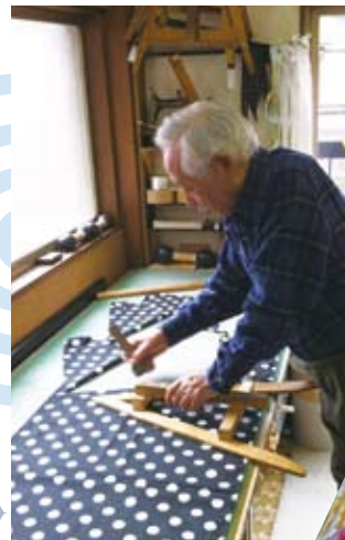
手づくりの木型を使い生地を裁断

傘は生産の多くが海外の工場に移って、都内でも職人はわずかです。傘の匠による手作り傘で、雨の日のおしゃれを楽しんでみてはいかがでしょうか？