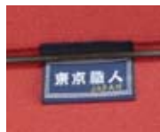
職人魂が込められたブランドタグ