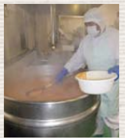
野菜のアク抜きも気の抜けない作業