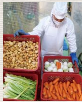
届いたばかりの野菜を丁寧に洗い巨大な機械でまるごとミンチに