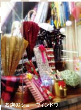
お店のショーウィンドウ