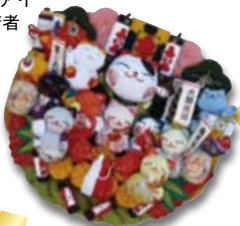
西の市でお会いしましょう!