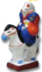
▲この時期は干支ものが人気。「馬乗り狐」はいかがですか?

◀丸猫(まるしめねこ) 丸猫は、招き猫の元祖とされています。背中にある文字「丸猫」とは「利益を丸くせしめる」という意味だそうです。