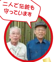
二人で伝統を守っています