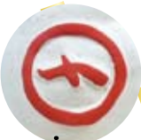
▲鮮やかな色は顔料を何層も塗り重ねています。

◀丸猫(まるしめねこ) 丸猫は、招き猫の元祖とされています。背中にある文字「丸猫」とは「利益を丸くせしめる」という意味だそうです。