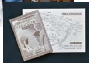
手帖は2013年のものです。