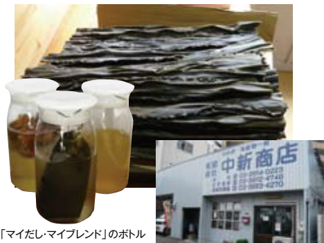
「マイだし・マイブレンド」のボトル

北区王子2-23-9 Tel.03-3914-0223 営業時間:8:00~19:00 年中無休