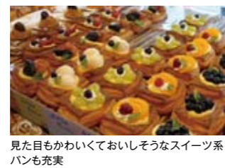
見た目もかわいくておいしそうなスイーツ系パンも充実