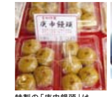
特製の「庚申饅頭」はこしあんを使用