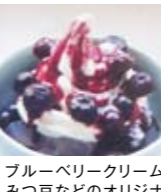
ブルーベリークリームみつ豆などのオリジナルスイーツも充実