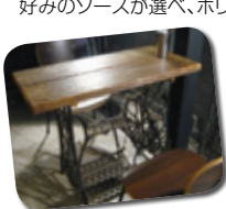
レトロなミシンを再利用したテーブル。