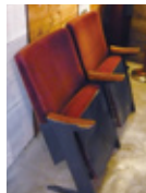
店名の由来は映画館・劇場。映画館でおなじみの椅子もあります。