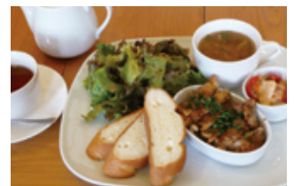
グリーンサラダが鮮やかな週替わりのプレートランチ。米粉パンがモチモチ!