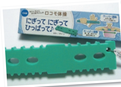
にぎってにぎって ひっぱって♪

高齢者の方が簡単に使用できる運動器具として商品名だけで使い方が分かるよう工夫した「にぎってにぎってひっぱって♪」など、健康管理に重点を置いた製品を企画開発・販売しています。