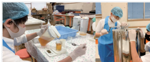
蜂蜜の加工や瓶詰めは有志の生徒が担当