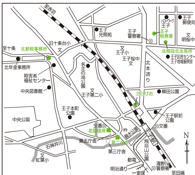
官公署案内図（北とぴあ周辺）