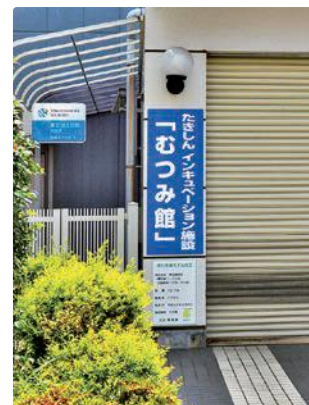
所在地: 北区田端新町 1-2-12 澁野川信用金庫 むつみ館 2階 問合せ: 03-3893-6176