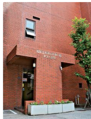
所在地: 北区赤羽 1-59-9 問合せ: 03-3598-0571