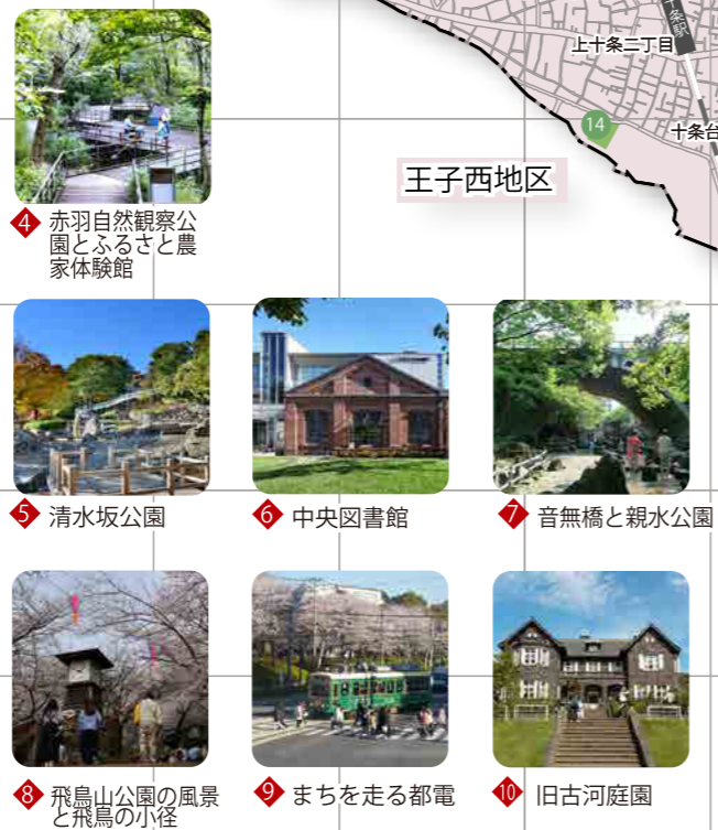
4 赤羽自然観察公園とふるさと農家体験館 5 清水坂公園 6 中央図書館 7 音無橋と親水公園 8 飛鳥山公園の風景と飛鳥の小径 9 まちを走る都電 10 旧古河庭園