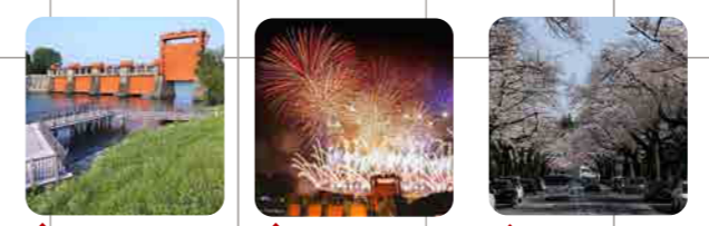
1 旧岩淵水門 (赤水門) 2 北区花火会 3 赤羽桜並木と赤羽台さくら並木公園

◆ 北区を代表する景観 10 選 2019 ● みんなでつくる北区景観百選 2019 ● 旧北区景観百選 (1998 認定) 河川 公園・緑地 線路、道路等の景観資源 北区の景観百選の所在地を地区別にマップに示しています。学校や職場、自宅の周辺など、身近にある景観資源を訪れてみませんか。また、自分好みの景観を探してみませんか。