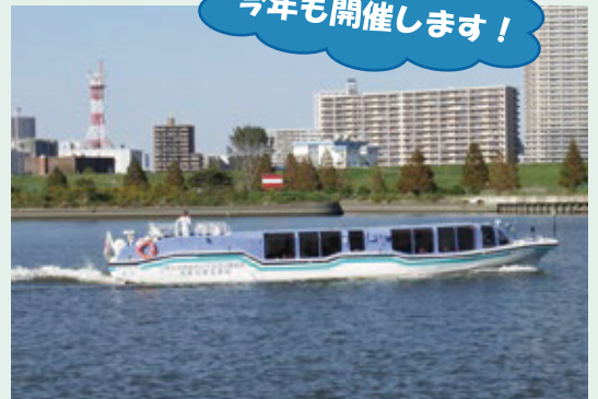
当日、乗船する災害対策支援船「あらかわ号」です。