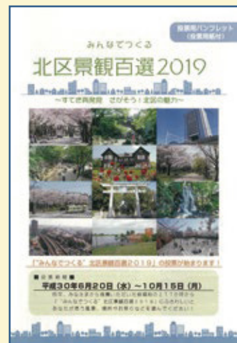
「投票用パンフレット」(全24ページ)