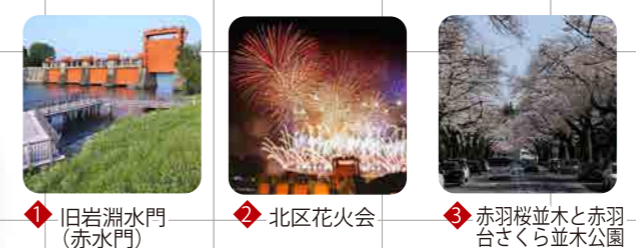
1 旧岩淵水門(赤水門) 2 北区花火会 3 赤羽桜並木と赤羽台さくら並木公園

◆ 北区を代表する景観10選2019 ● みんなで作る北区景観百選2019 ● 旧北区景観百選(1998認定) ● 河川 ● 公園・緑地 ● 線路、道路等の景観資源 北区の景観百選の所在地を地区別にマップに示しています。学校や職場、自宅の周辺など、身近にある景観資源を訪れてみませんか。また、自分好みの景観を探してみませんか。