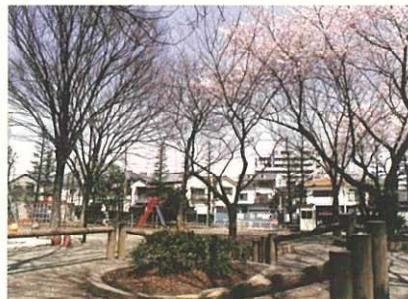
所在地 北区十条台2-5-13 問い合わせ先 北区役所道路公園課 TEL. 03(3908)9275

緑と遊具、広場などがバランスよく配置されている子どもたちには格好の遊び場です。大きなケヤキの木が見守る中、毎日日暮れまで、元気な子どもたちの歓声が聞こえます。