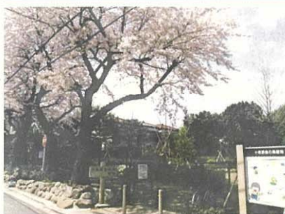
所在地 北区上十条1-22-30 問い合わせ先 北区役所道路公園課 TEL. 03(3908)9275 入場 午前8時~午後5時(4月~9月は~午後6時)

住宅地の中の、緑あふれるうるおいのスペースです。バードサンクチュアリー(野鳥のための聖域、人は入ることはできない区域)が設けられてあり、清々しい鳥たちのさえずりに、心も洗われるようです。