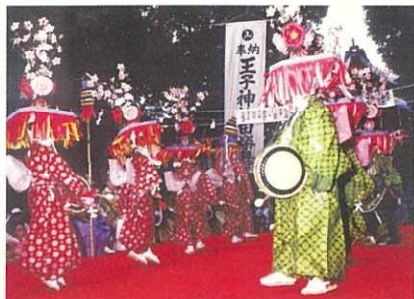
所在地 北区王子本町1-1-12 王子神社内 入場 毎年8月上旬の日曜日

王子神社の例大祭にあわせて奉納されます。愛らしい子どもたちが、ゆったりとした笛や太鼓、さらさら(竹の先を割って束ねた楽器)の調べに合わせて舞う、手作りの暖かさで格式が伝わってくる伝統行事です。