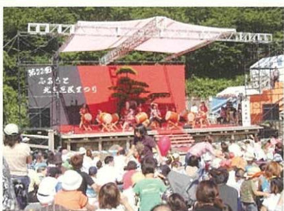
所在地 北区王子1-1 飛鳥山公園他 問い合わせ先 北区役所地域振興課内 ふるさと北区 区民まつり実行委員会事務局 TEL. 03(3908)8142 入場 毎年10月第1土曜日と翌日曜日

飛鳥山公園特設ステージ上のアトラクションやレクリエーションコーナー、町会自治会連合会・商店街による出店、フリーマーケット、国際ふれあい広場など区民手作りの催し物がいっぱいあります。赤羽会場・滝野川会場の3会場同時開催で、多くの区民の方々で賑わいます。