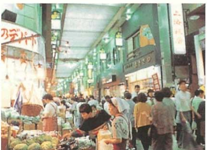
所在地 北区上十条2丁目、十条仲原1丁目辺り 問い合わせ先 十条銀座商店街振興組合 TEL. 03(3907)3860

約180軒の店舗があり、昼・夜を問わず人通りが多く、活気がみなぎっています。昭和52年に取付けられ、平成10年にリニューアルされたアーケードは、長さが524mもあり、都内屈指の規模を誇ります。